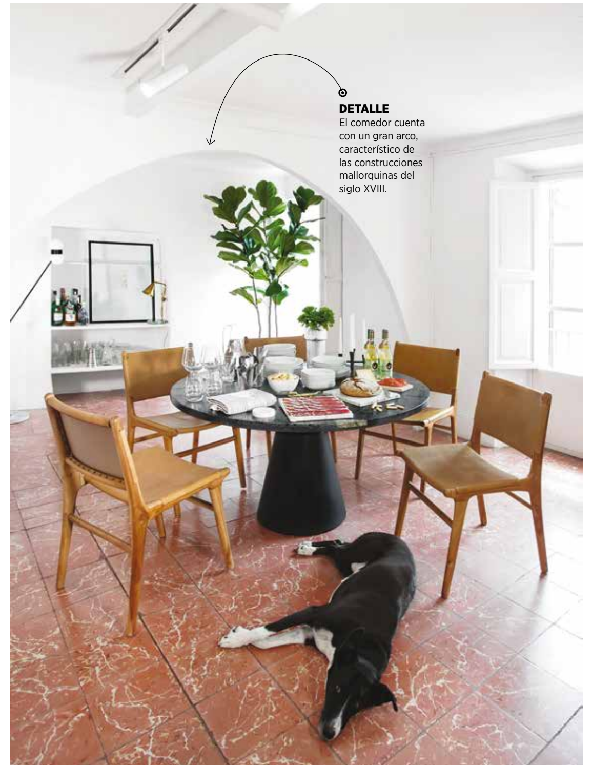
DETALLE El comedor cuenta con un gran arco, característico de las construcciones mallorquinas del siglo XVIII.