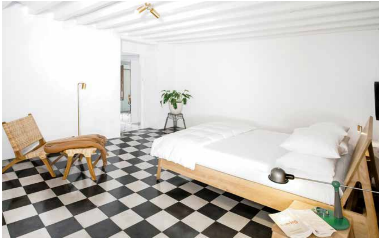
Arriba En el dormitorio, las paredes gruesas conservan la frescura en el espacio y aíslan cualquier ruido. El suelo de damero tiene el papel protagonista, el sillón lounge tejido en rafia fue importado de Indonesia, y los demás muebles son de la firma belga Ethnicraft. Página opuesta En la sala de baño adornada con lámparas de Contain, la tina es de una sola pieza de mármol de carrara tallada, cuyo peso está sostenido por dos grandes paredes que se encuentran en el sótano de la finca.